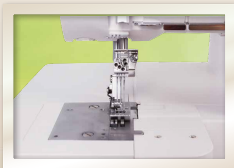
Zone de la couture