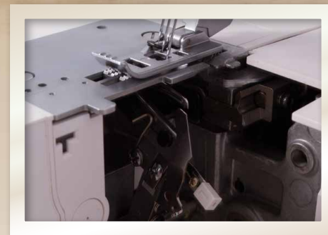
Aide d'enfilage pour le boucleur inférieur