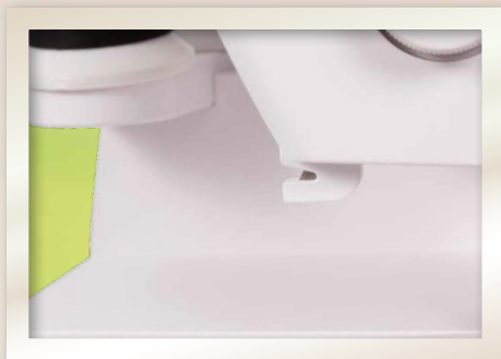
Lame coupe-fil intégrée