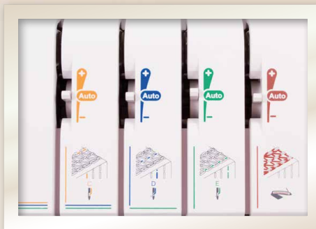
Tension de fil automatique